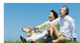
サービスナビゲーター あなたに合うオススメの サービスを紹介

認知機能低下の予防に資する運動や学習、音楽や睡眠のサポートプログラムなどニーズに合わせた幅広いサービスを選んでご利用いただけます。生活習慣や趣味に関する約 20 問の質問から、それぞれのご利用者のニーズに合ったお勧めのサービスをご提案するツール「サービスナビゲーター」をご用意しています。なお、これらの認知機能低下の予防サービスについては、治療行為に該当するものではありません。