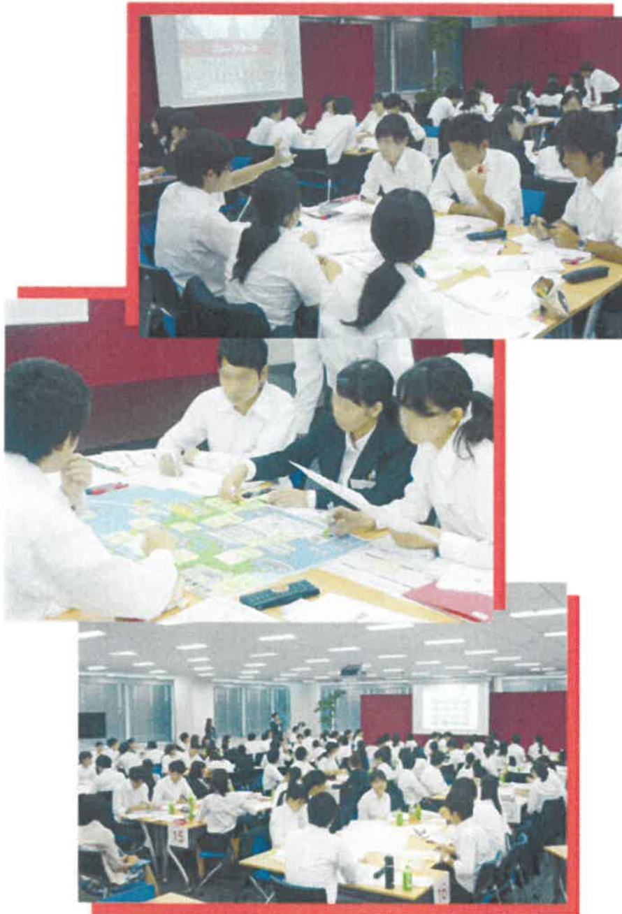
“総合コース”の様子