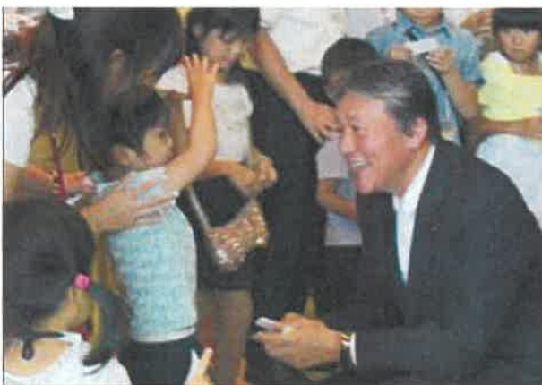
社長との名刺交換会

SOMPOホールディングスグループでは、職場コミュニケーションの活性化、社員を支える家族に会社を理解してもらうことを目的に、2007年から継続的にサンクスデーを開催しています。また、社員は家族を職場へ招待し、感謝の気持ちを伝える場にもしています。例年、社員と家族の相互理解を深める笑顔のあふれるイベントになっています。