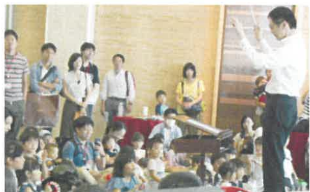
損保ジャパン日本興亜管弦楽団による演奏