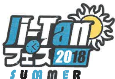
「Ji-Tan(時短)フェス2018」のロゴ