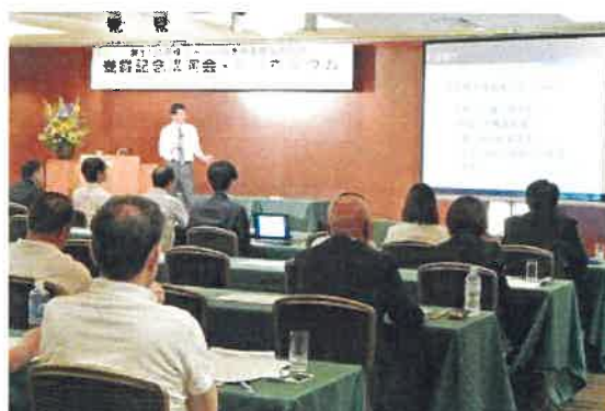
2018年7月 受賞記念講演会とシンポジウム