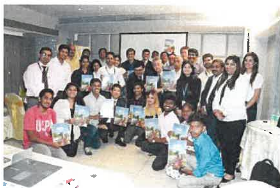
インドでの贈呈式

2018年度は、若者世代の事故減少に向けての啓蒙活動・ガイドブックの作成（インド）や、貧困層の自立を目指した子どもたちへのサポートプログラムの提供（フィリピン）など、5カ国の5団体に助成しました。