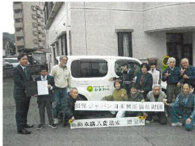
野菜を作っている畑までの送迎に大活躍

1999年から障がい児・者に対する福祉活動を行う団体に自動車購入費を支援する事業を行っています。2018年度は、西日本地区の10団体に助成をしました。自動車の購入支援を通じて、団体の活動範囲や活動規模が拡大することで、障がい児・者の収入の増加や利用者の増加に貢献しています。