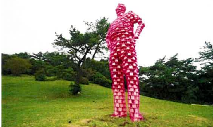
(写真:「六甲ミーツ・アート 芸術散歩2018」/木村剛士 畑になる/人)

SOMPOアート・ファンドでは、創造性にあふれる未来の社会づくりに繋げていくため支援先とSOMPOアート・ファンドが目指す姿を共有する機会や、文化・芸術活動に携わる方々のネットワーク形成を目的にキックオフ・ミーティングや取組好事例の発表会を当社新宿本社ビルなどで開催しています。2018年度は全国16の文化・芸術活動への支援を行いました。