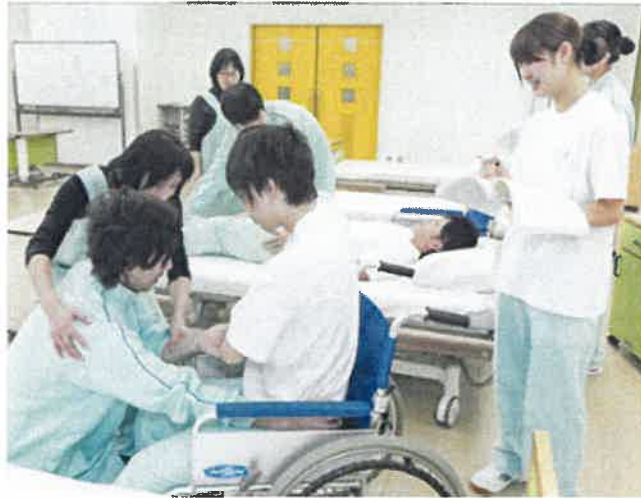
介護福祉士を目指す学生の実習風景