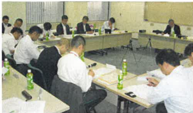
保険業法に関する研究会

ジェロントロジー（老年学）分野における独創的・先進的な研究などに対して隔年で研究助成を行っています。他にも保険業法に関する研究会、健康保険・介護保険システム研究会、ジェロントロジー研究会などを開催しています。また、財団叢書を発行して図書館など、広く一般的に研究の成果を公開しています。