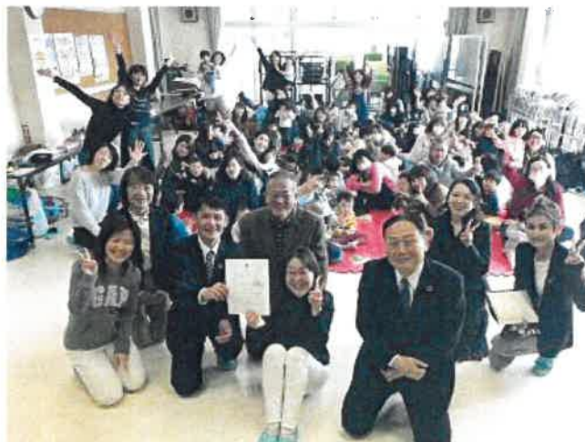
多くの方に共感してもらえらる団体を目指し認定NPOを取得

2018年度は、「組織の強化」と「事業活動の強化」に必要な資金を助成するプログラム、認定NPO法人の取得資金を助成するプログラム、地域住民が生活課題に包括的な支援を行うための住民参加型の福祉活動資金を助成するプログラムを合わせて、64団体に助成しました。地域の中核となり、持続的に活動する質の高いNPO法人づくりの支援や、地域共生社会を実現するための支援をしています。