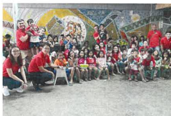
フィリピンでの贈呈式