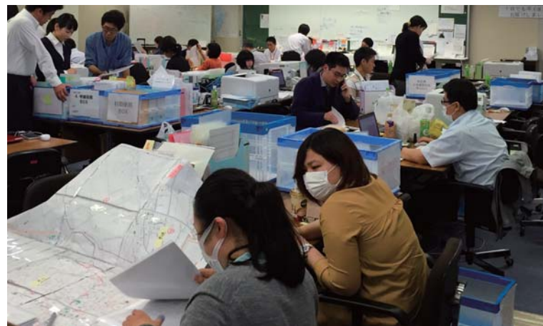
上：社員派遣プログラム 団体での活動の様子／宮城県石巻市 下：東北3県 復興支援マルシェ