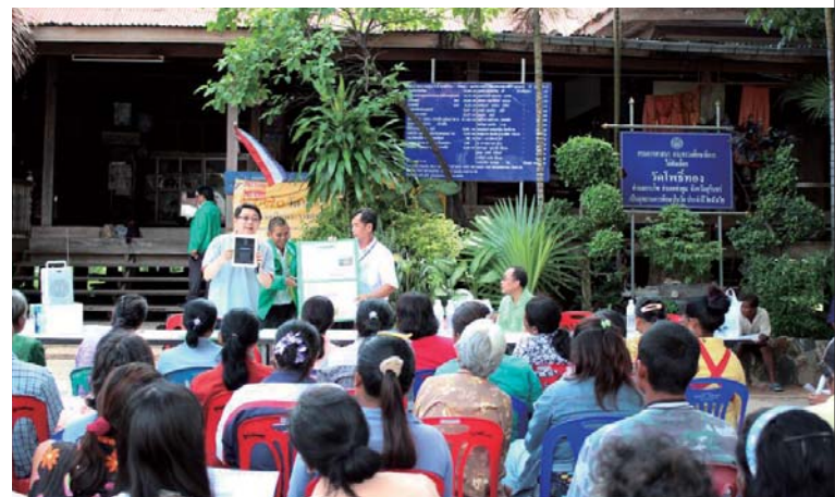
商品の説明会の様子/タイ