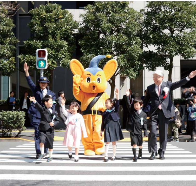
交通安全教室の様子