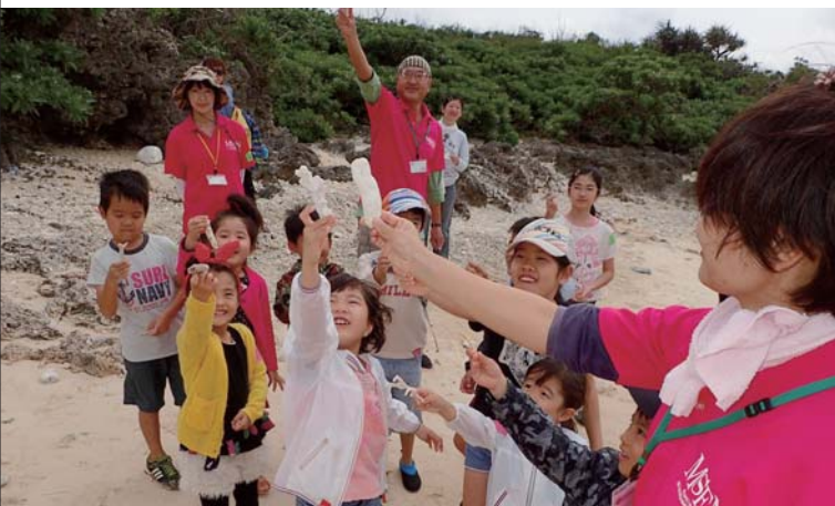
上：八郎湖の自然観察会 ～昔の八郎湖に思いを馳せる～／秋田 下：さんご礁の海岸を探索しよう！／沖縄