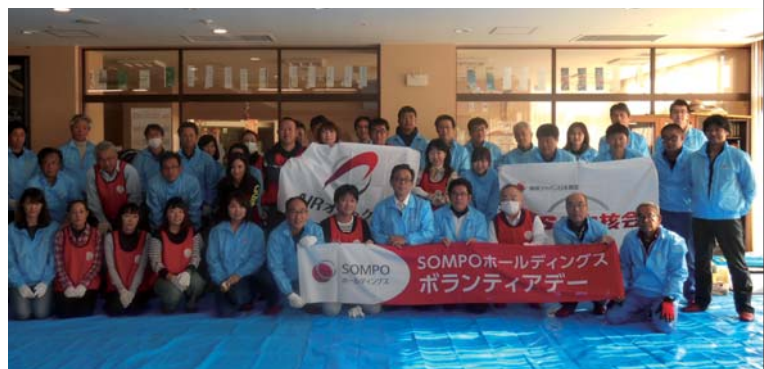
上:「社会福祉法人 くすのき」での活動/神奈川 下:「社会福祉法人 高田福祉事業協会 高田慈光院」での活動/三重