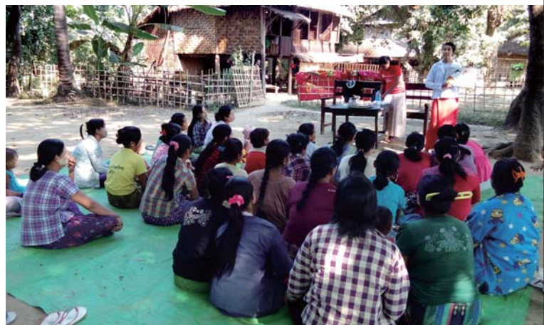
上:研修を受けた助産師、補助助産師 下:地域住民を対象とした保健センターへの視察訪問