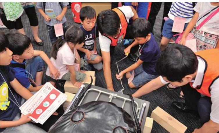
NPO法人プラス・アーツと協働した「体験型防災ワークショップ」 上: 応急手当ワークショップ 下: ジャッキアップゲーム