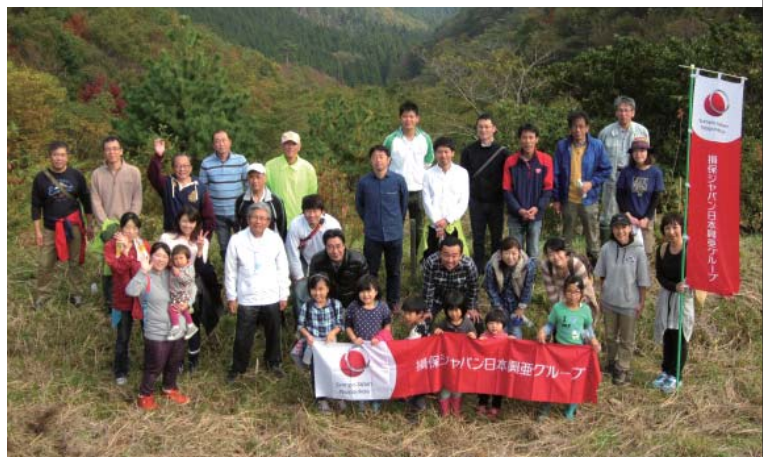
上：「赤城の森林」での活動／群馬 下：「とっとり共生の森」での活動／鳥取