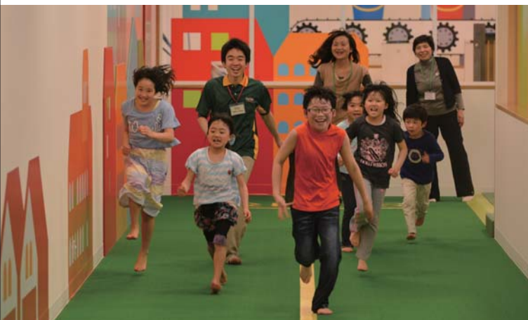
上:タイの地方マーケットのバリアフリー化に助成 下:福島の子どもの心身のケアや屋内遊び場の運営支援