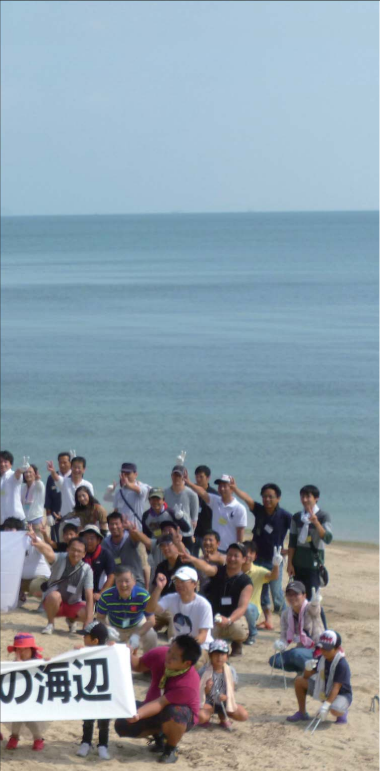
▲ 8回目を迎えた瀬戸内海清掃活動／香川

「CSRブックレット」は、当グループのCSRのさまざまな取組みの一部を簡潔に紹介するブックレットです。