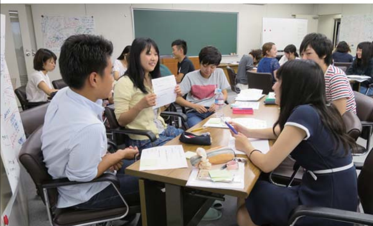
上:「市民のための環境公開講座」野外講座～食べる自然体験～ 下:「CSOラーニング制度」全国合宿