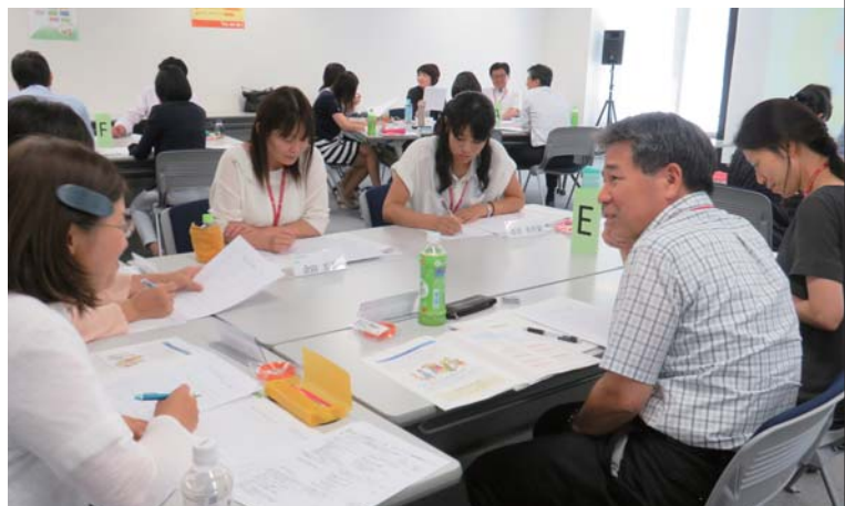
上: SOMPOホールディングス ボランティアデーに講座を開催(セゾン自動車火災・そんぼ24) 下: 認知症サポーター育成に向けた研修の様子(損保ジャパン日本興亜保険サービス)