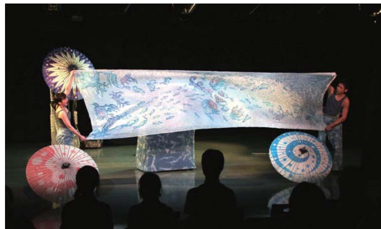
上:小児病棟を訪れるパペットミニキャラバン 下:パペットシアターゆめみトランクによる公演