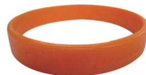
認知症を支援する「目印」オレンジリング