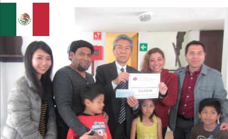
上:日本人学校修繕/南アフリカ共和国 下:施設への寄付/メキシコ