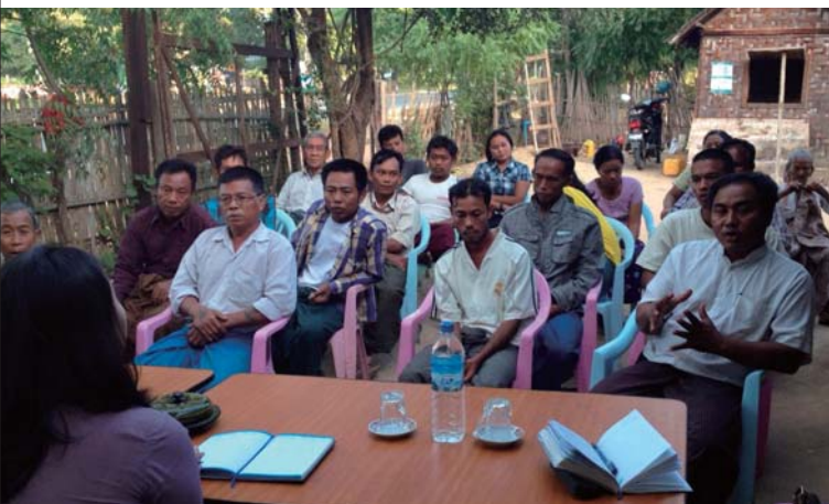
上:保険金支払い手続き説明会の様子/タイ 下:ヒアリングサーベの様子/ミャンマー